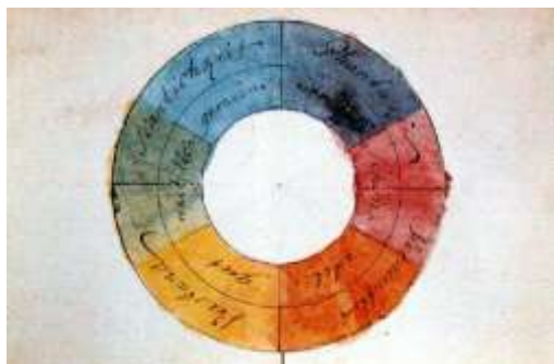
Johann Wolfgang von Goethe, koło kolorów